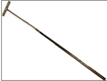
Figur 1. Jordspett med en diameter på ca 2-3 cm och en längd om ca 1,5 m.

dokumenteras i fält. Jordprovtagningen med jordspett är en av de metoder som lämnar minst spår efter sig och orsakar sällan visuella störningar . För närvarande planeras uttag av totalt ca 5 handprovtagna samlingsprov inom hela koloniområdet.